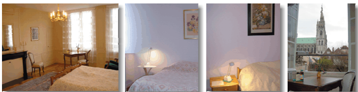
Centre Œcuménique & Artistique (13 Rue du Docteur de Fourmestraux).

La Ville de Chartres est située à 1h de Paris, facilement atteignable par le train. Sa cathédrale, inscrite au patrimoine mondial de l'UNESCO est d'une qualité artistique exceptionnelle.